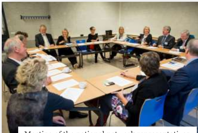
Meeting of the national network representatives

Selle tõttu toimub ka Euroopa Sotsiaalvõrgustiku aastakonverents Juunis Hollandis. Leido on väljendanud soovi korraldada sellel üritusel õpikoda, et tõsta teadlikkust TAP projekti kohta, kuid üks teine Hollandi organisatsioon Cordaid on samal teemal oma projekti välja pakkunud, ning viimaste pakkumine võeti vastu. Kuna mõlemad organisatsioonid võitlevad vaesuse vastu, saavad nad hoida ka kontakti ja koos minna ühise eesmärgi poole.