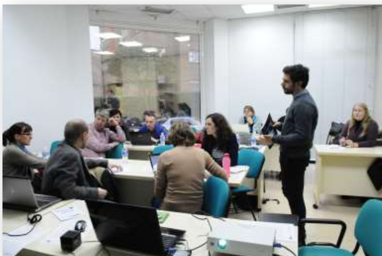
Partnerriikides toimuva levitamistegevust puudutava info jagamine.

Partenrid nõustusid O3 kavandiga, mille valmistas ette CILSDGC (Rumeenia) ning arutasid struktuuri üksikasjade ning sisendite tähtaegade ja O1 väljundite üle O4 jaoks, mille eest vastutab CECE (Hispaania). Lisaks sellele seati O3 ja O4 hindamis- ning tõlketööde tähtajad.