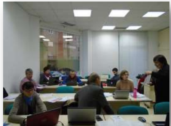
Ettevõtluskoolituse õpingukava tagasiside arutelu. (O3)

Samas aruandes tehtud soovitusel toovad välja, et õppijad peavad muutuma eneseteadlikumaks ning õppima kasutama oma sisemist ressursi, mis toetab ettevõtlust; muutuda enesekindlamaks, et käituda nagu ettevõtja; vajadus omada praktilisi teadmisi õiguslikust raamistikust, finantsidest ja turundusest ning saada tuge oma karjääri lühi- ja pikaajalisel planeerimisel.