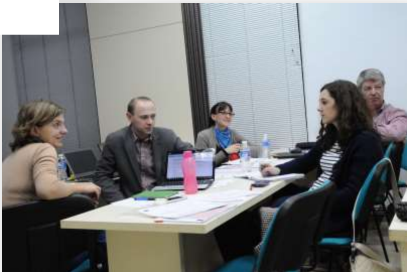
Partnerite vaheline arutelu.

Arutelu puudutas ka levitamistegevust partnerriikides, hindamisprotsessi ning Poola Rahvusagentuuri poolset TAP projekti auditit. Partnerid võtsid arvesse kõik rahvusagentuuri poolsed soovitusel edaspidise koostöö jaoks. Jõuti kokkuleppele TAP projekti järgmise uudiskirja teemade osas ning käsitleti administratiivseid ning rahalisi küsimusi.