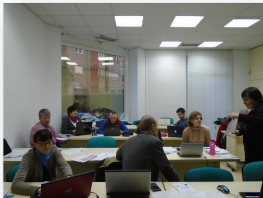
Feedback la curriculumul formării pentru dezvoltarea antreprenoriatului (O3)

Am reținut din raportul Sărăcie și excluziune socială în câteva țări europene (Szczygieł, 2015) că persoanele sărace sau excluse social sau în risc de sărăcie și excluziune socială s-ar putea să considere că este imposibil sau nerelevant să acționeze pentru a-și îmbunătăți situația financiară. Raportul a concluzionat că persoanele în risc de sărăcie sau excluziune socială cu care am luat legătura sunt obișnuite cu situația lor și manifestă interes limitat să își schimbe situația. Mai degrabă preferă să recurgă la strategii de limitare a nevoilor curente, la utilizarea ajutorului social sau la împrumuturi. Soluția de a accepta muncă în plus a fost indicată abia de către un sfert dintre respondenți. În mod clar, perspectivele de a găsi locuri de muncă sunt limitate nu doar de considerente personale, dar și de condițiile socio-economice actuale. În ce privește demararea propriei afaceri, respondenții au indicat lipsa spiritului antreprenorial care i-a împiedicat să demareze afacerea proprie.