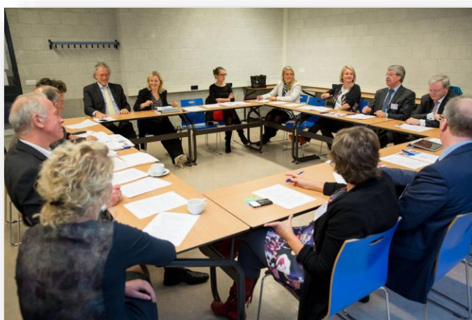
Întâlnirea reprezentanților rețelei naționale din Olanda

Contactele pe care le avem ca urmare a anchetei realizate în 2015 se dovedesc acum profitabile. Unele dintre municipalitățile la care am apelat în Ancheta O2 pentru a afla mai multe despre structurile pe care le folosesc pentru a sprijini persoanele în risc de sărăcie și excluziune socială au arătat interes pentru a găzdui întâlnirea finală a partenerilor din proiectul TAP.