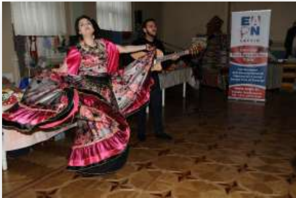
Muusikaline Rooma rühmi tervitus käsitöö näituse ajal

Osalejad kohtumistel ja näitustel jagasid kogemusi koostöös inimestega riskirühmadest ja heade tavadega inimestega kuidas motiveerida neid õppima ja hakata ettevõtjaks saama.