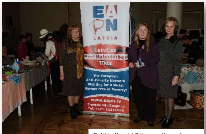
Balti kolleegid Riias, aprill 2016

Osalejad kohtumistel ja näitustel näitasid parimaid tavasid loomingulistest töedest, tervishoiu-, pereettevõtted, turustamise ja koolitusi.