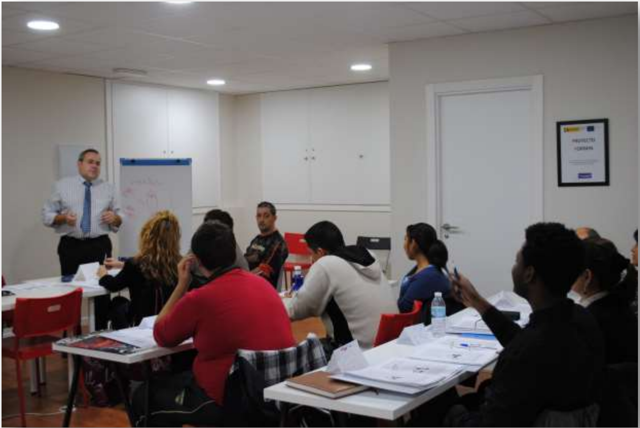
Ekspert ja O3 gruppi õpilased

Peamine eesmärk TAPi projektis on ennetada vaesuse arendamist ja rakendada õppevahendeid. Seega kogu istungitel olid esitatud erinevad juhtumid riikides, mis oli projektis. Meil ei olnud raskusi probleenide lahendamises. Mõned neist oleks kergesti ülekantev ka Hispaaniasse.