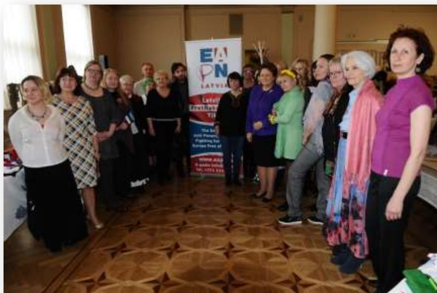
Osalejad Euroopa vaesusvastase võrgustikku Läänemere piirkonnas