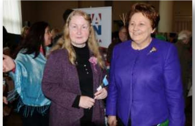
Mitra juhatuse liige Ruta Pels koos endise Läti peaministriga Laimdota Straujumaga