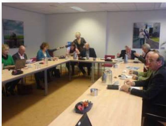
Ekspertide kohtumisel - O4

Juhtumid vaesuse ja sotsiaalse tõrjutuse teistes riikides andis ekspertidele parima võimaluse analüüsida neid erinevatest vaatenurkadest. Iga ekspert sai ütelda oma arvamuse, kuidas võib probleemi lahendada.